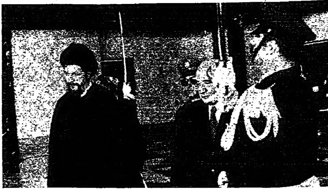
مساحة الامام موسى الصدر لدى وصوله الى قصر بعيدا امس